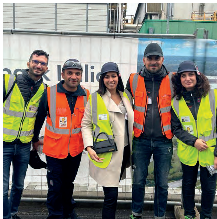
Lo staff di MHW presente all'inaugurazione

le bevande, ha realizzato il nuovo stabilimento su una superficie di 347.000 mq di cui, circa la metà, dedicata agli impianti produttivi veri e propri, con un incremento della capacità del 70% grazie a tecnologie all'avanguardia che assicurano anche maggiore flessibilità, efficienza e sostenibilità dei processi. Le tecnologie avanzate del nuovo stabilimento consentono un utilizzo estremamente efficiente delle risorse e una significativa riduzione dell'impatto ambientale dell'azienda. Quello di Boffalora sopra Ticino è l'unico stabilimento Vetropack attivo in Italia.