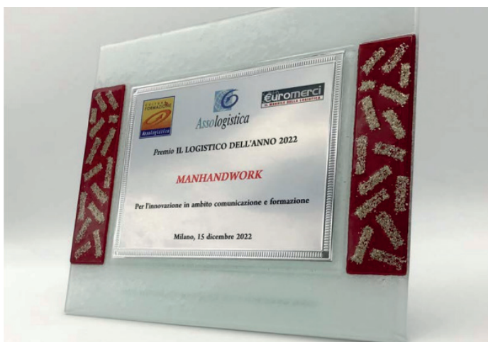
Il riconoscimento di Assologistica assegnato a MHW

“Ad oggi, la società conta nel suo organico più di 20 diverse nazionalità e investe con orgoglio sui giovani talenti, offrendo loro programmi di inserimento e sviluppo competenze. Sempre nell’ottica di valorizzare e coinvolgere le nostre persone, organizziamo periodicamente importanti eventi interni, che prevedono la partecipazione di headquarters, responsabili di impianto e team leader e che hanno un duplice scopo: da un lato formare gli addetti alla gestione di magazzini e risorse, dall’altro sensi-