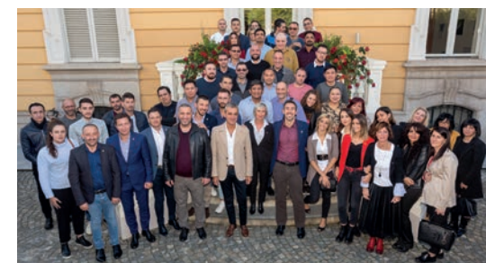
Alcune immagini del primo workshop MHW

La prima convention aziendale di ManHandWork , “ Method Helps Work ”, è stata un grande successo, che ha permesso all'azienda di consolidare la rete tra i tanti collaboratori e le diverse professionalità che operano ogni giorno in tutta Italia. Un momento di condivisione, di costruzione di una squadra, ma anche un'importante occasione per costruire un metodo di lavoro condiviso che permetta di crescere ancora insieme. Proprio per questo, la convention aziendale non può essere intesa come un momento isolato ma, nelle intenzioni di ManHandWork , è un appuntamento periodico per confrontarsi,