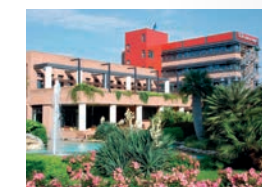
Il centro congressi e la sala dove si svolgerà l'incontro