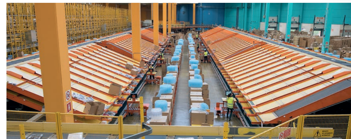
Alcune immagini dell'impianto Connecthub di Mantova.

È partita il primo luglio una nuova importante collaborazione per ManHandWork : quella con Connecthub , primo Full Enabler Omnichannel Digitale e Logistico in Italia. Connecthub , azienda di Mantova, è da sempre un player fondamentale nel mercato italiano della logistica omnicanale e integrata, ed è un'azienda di grande avanguardia nel suo campo: un unico soggetto capace di supportare l'evoluzione digitale delle aziende. L'azienda, di proprietà della famiglia Thun, rappresenta un partner davvero importante per ManHandWork , che grazie a questa collaborazione andrà a lavorare in uno degli impianti più tecnologicizzati del Paese. Il valore aggiunto che ManHandWork può dare a una simile realtà è proprio l'efficienza umana, che va sempre combinata con quella artificiale per garantire il massimo risultato. La collaborazione con un'azienda all'avanguardia come Connecthub , infatti, ha messo in luce l'importanza dell'organizzazione del lavoro in maniera efficiente, indispensabile per portare al massimo potenziale le tecnologie.